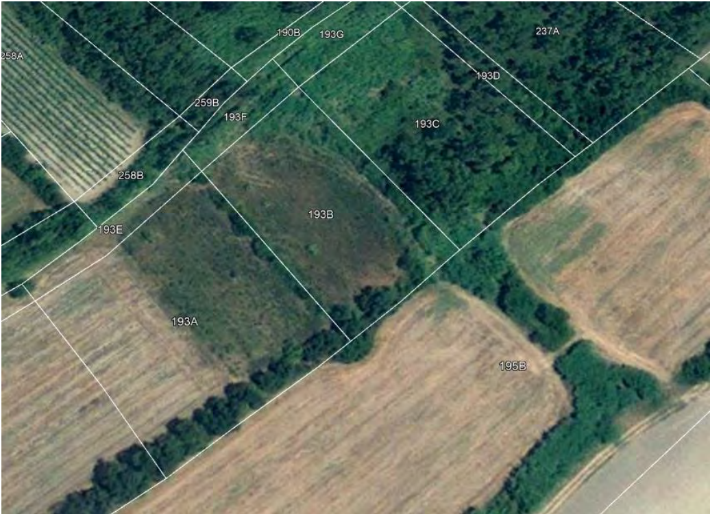
Ortofoto google earth 2013