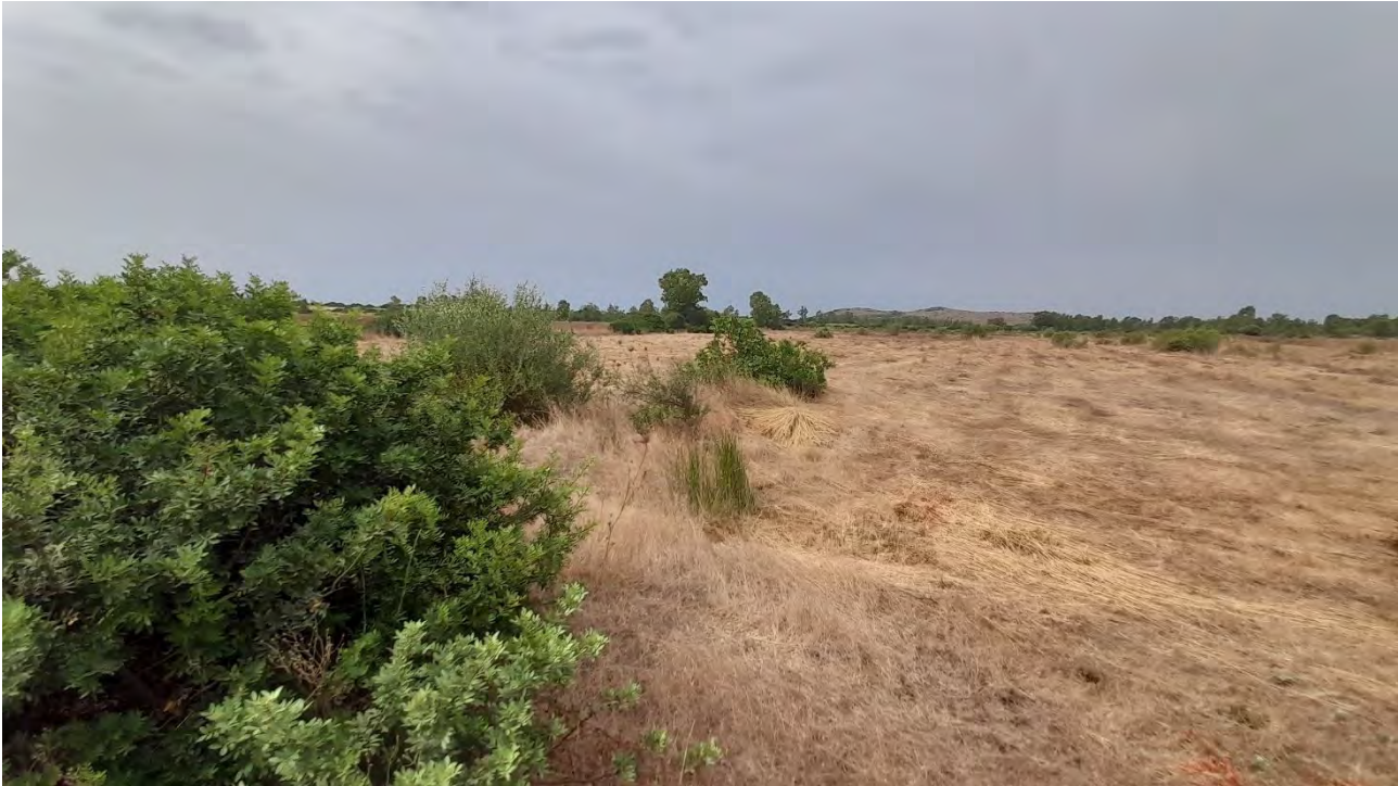
GIBA FOGLIO 201 MAPPALE 327