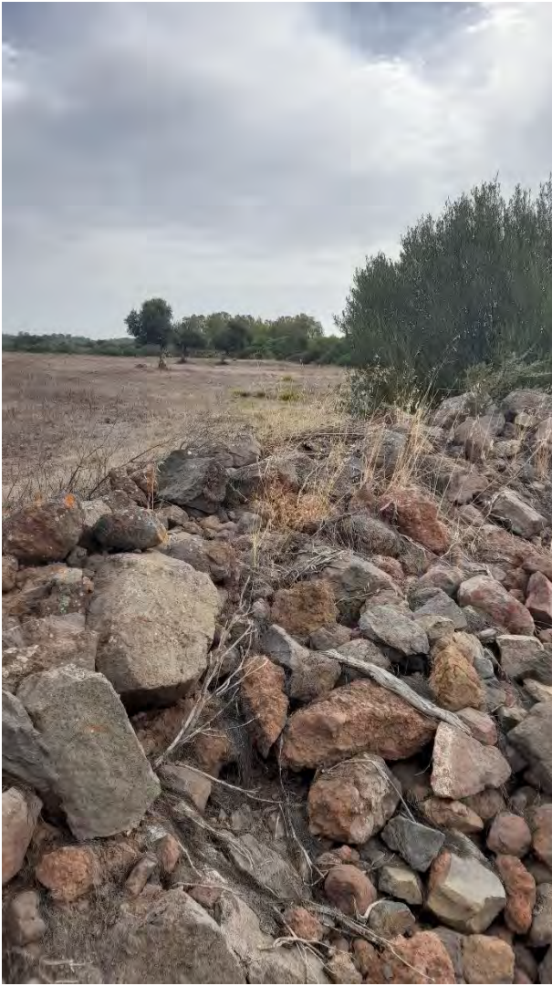
GIBA FOGLIO 201 MAPPALE 572