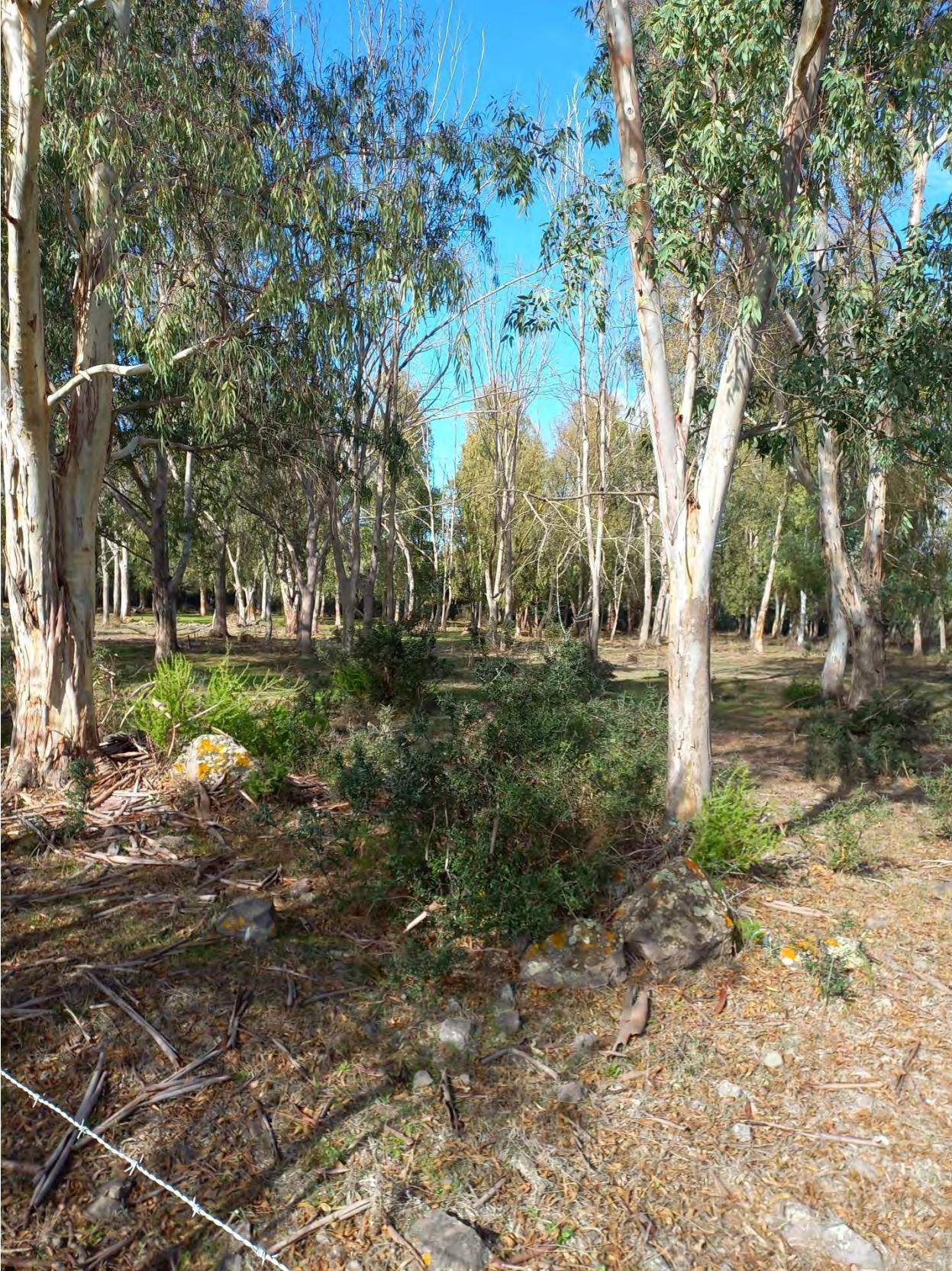
SGS FOGLIO 43 MAPPALE 140A