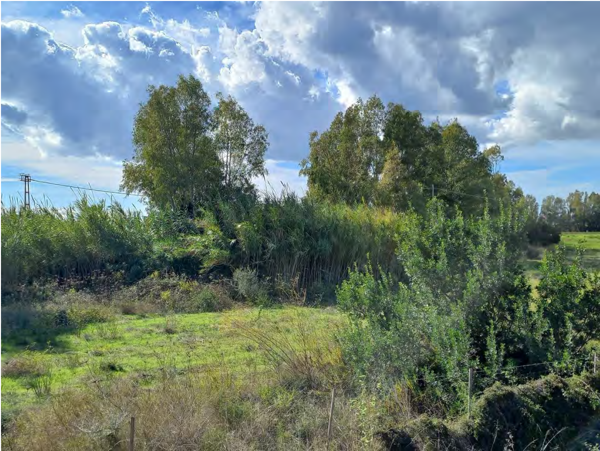
GIBA FOGLIO 202 MAPPALE 13,14,15,91,92